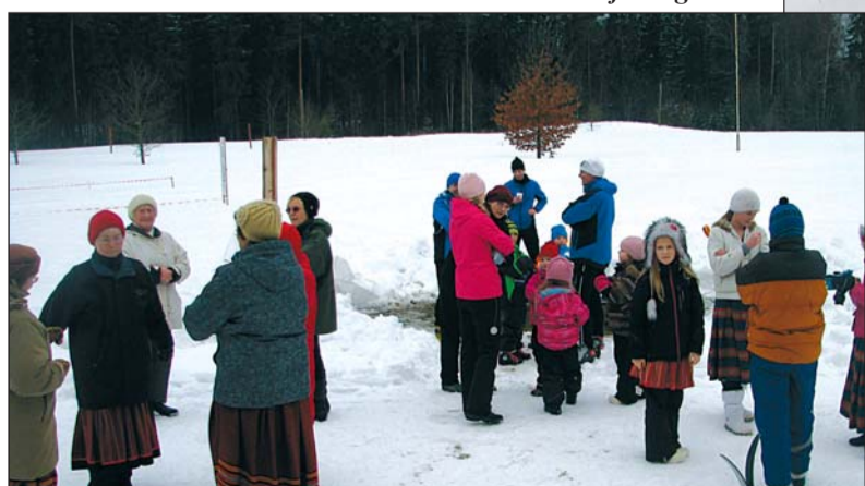
Üks tore vabariigikaerajaan.