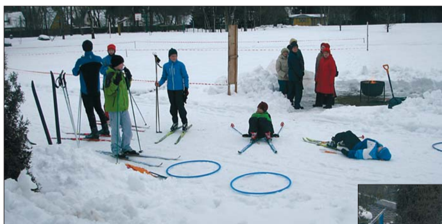
Väsinud suusatajad ja mõnus pühadetuli.