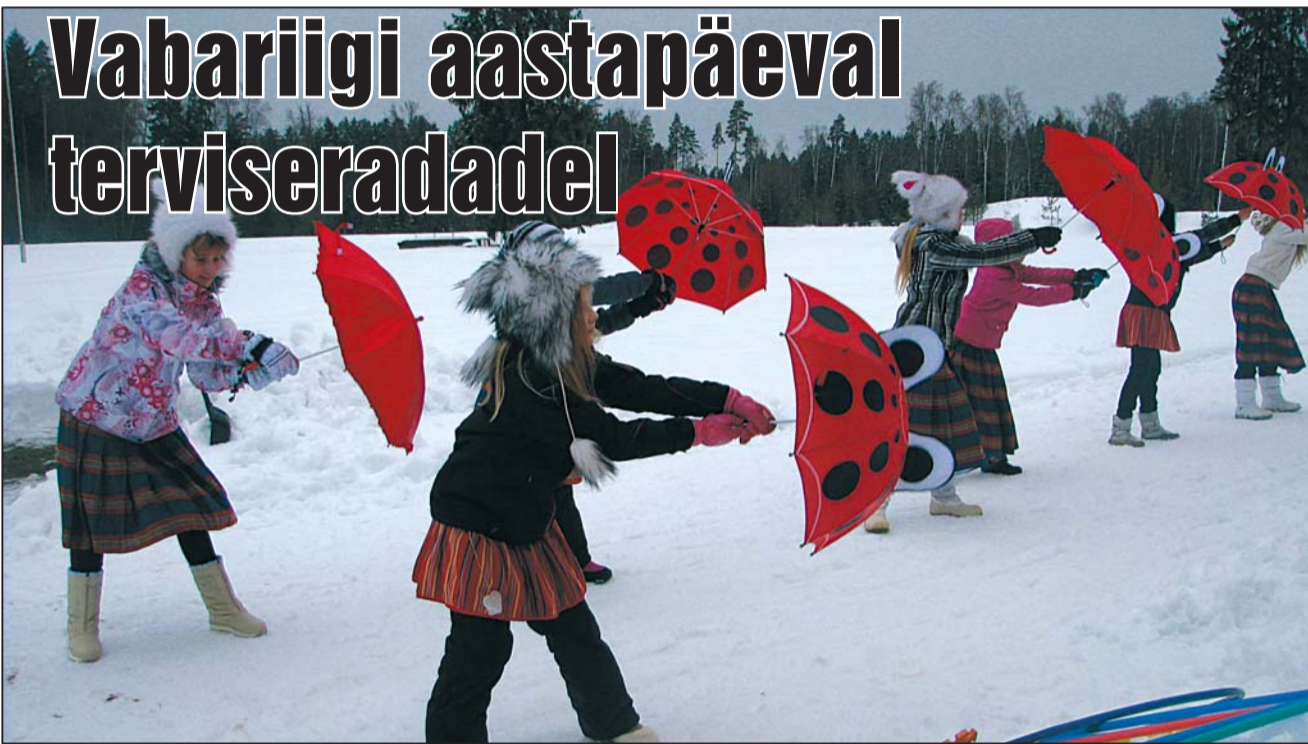
Rahvariided, jänkumütsid ja vihmavarjutants.