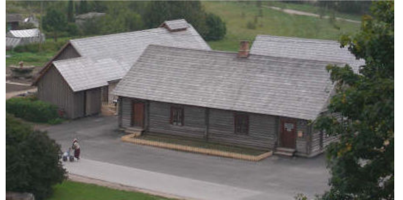
Järvakandi Klaasimuseumi kompleks

Järvakandi valla arendusnõuniku Sirje Metti sõnul jäid hindajad EAS-ist projekti täitmisele väga rahule ja olid imestunud, et võrreldes teiste