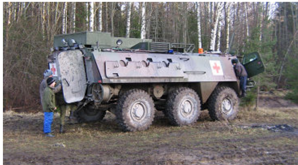
Soomukit uudistamas.

Kaitseliidu Rapla maleva Tedremuru sauna juurde püstitati sissitelkide laager. Iga telkkond pidi ise hoolitsema selle eest, et puud oleks olemas ja valves olev kütja ei jääks magama ega laseks ruumil maha jahtuda. Juhul, kui neid nõuded täidetakse, on sellises „majakeses“ õõbimine tõeline lust, külje all kuuseoksaia leho. ning ise sügaval magamiskotis.