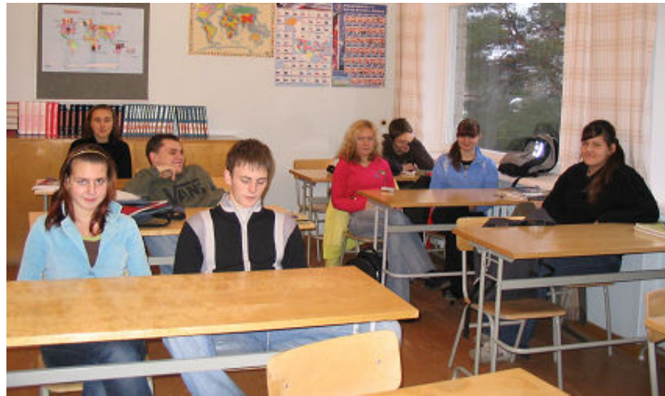
Järvakandi Gümnaasiumi abiturientid tunnis.

Kahjuks ei laeku ca 20-25% Järvakandi alevi ettevõtete töökohtadel välja teenitud füüsilise isiku tulumaksust koduvalda. Oleme alati väitnud, et vallavalitsusel ei ole vastuväiteid lähikülade ja Kaisma ning Raikküla vallast töölekaivate suhtes. Kuid meil on kahju, et Järvakandi ettevõtlus toidab oma elanike arvel vabariigi pealinna Tallinna, kuhu on koondunud suurem osa rahalistest vahenditest, Eestimaa rikkamat Viimsi või vabariigi suurimat Märjamaa valda. Valla elanikkonna üksikisiku tulumaksu laekumise koha määrab Eestimaa elanike registri sissekanne kohaliku omavalitsuse territooriumile seisuga 31. detsembril laekumisele eelneval aastal. Detsembris pöördusin rea AS Järvakandi Klaas „võõrleegionäride“, kes elavad Järvakandis, poole ettepanekuga kanda