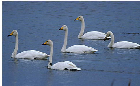
Viiruse levitajateks peetakse just veelinde

Linnugripi, mille põhjustajaks on viirustüvi A/H5N1, on lindude jaoks eriti nakav ägedalt kulgev ja ravimatu haigus, millega kaasneb massiline haigestumine ja suremus.