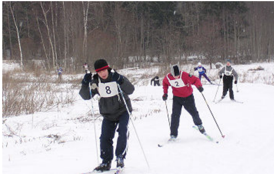
Maakonna noorsuusatajad Tupiku tõusul

Loo pealkirja juurde tagasi tulles (suusarajal võiksidki ju kõik suusatada) ei tahaks uskuda, et täiskasvanud inimesed ei saa sellest aru ja võtavad suusarada kõnnitee pähe!? Kõik ei viitsi jala ka käia ja need autodega "rajavägistajad" on muidugi erilisel "KÕVAD TEGIJAD" (rada ei hakka eriti ju vastu ka).